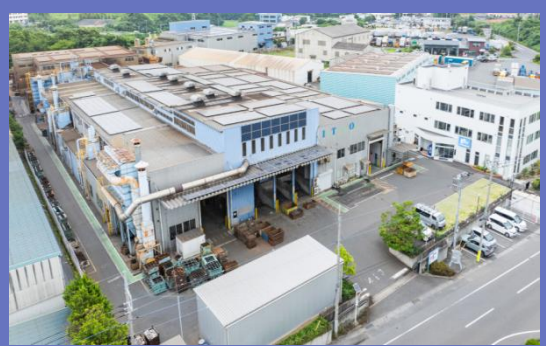
本社・工場（平原南部工業団地内）